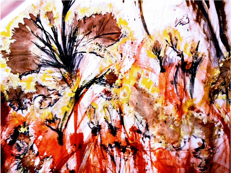
Performance público. Plaza Regina, Xalapa.