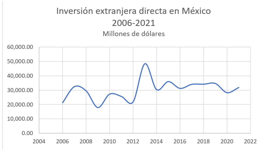
Figura 4. Inversión extranjera directa en México