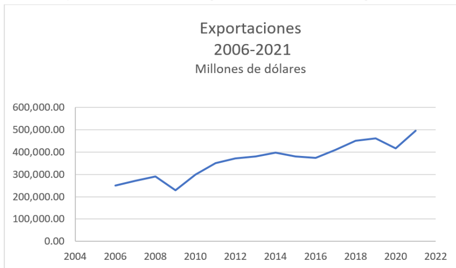
Figura 3. Valor de las exportaciones mexicanas por año