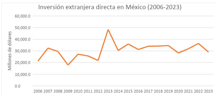
Ilustración 1: inversión Extranjera Directa

Las siguientes ilustraciones son con respecto a la recaudación de impuesto y es información recabada de la página oficial INEGI y se aprecia que año tras año la recaudación ha ido en aumento.