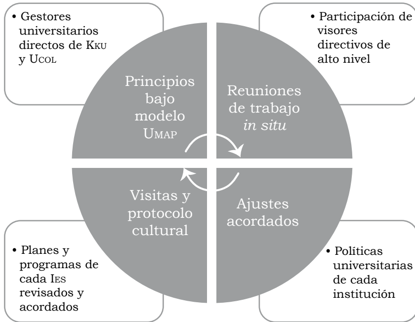
Diagrama 1 Modelo de revisión del programa de doble grado en Kku-Ucol