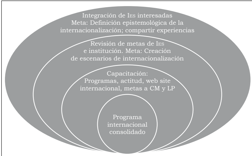
Diagrama 3 Modelo de consolidación del programa internacional