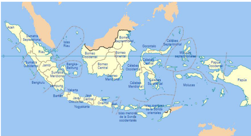
Imagen 1 Mapa político de Indonesia

cidental. 5 La anexión tardía implicó para la población local la pérdida de su identidad, cultura y libertad. Como resultado han surgido movimientos nacionalistas y separatistas como reacción de rechazo frente a la integración. La “indonesianización” de ambas regiones, como afirma Gietzelt (1989), se llevó a cabo a partir de tres vías principales: la educación, por medio de la enseñanza del idioma oficial, el bahasa indonesia ; el contacto con el grupo étnico mayoritario, que son los javaneses para fortalecer la unidad y homogeneizar la cultura y, finalmente, el desarrollo económico y la modernización, que tuvo como eje el programa de transmigración. La efectividad de este programa para integrar a los papúes será examinada en ese artículo.